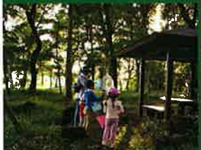
トラスト保全地の部 優良賞「森への窓口」(トラスト12号地)