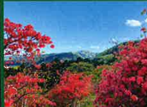
身近な緑の部 優良賞「天空のつつじ」(寄居町)