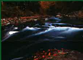
トラスト保全地の部 佳作「秋色の渓谷」(トラスト3号地)