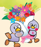
埼玉県マスコット 「コバタン&さいたまっち」