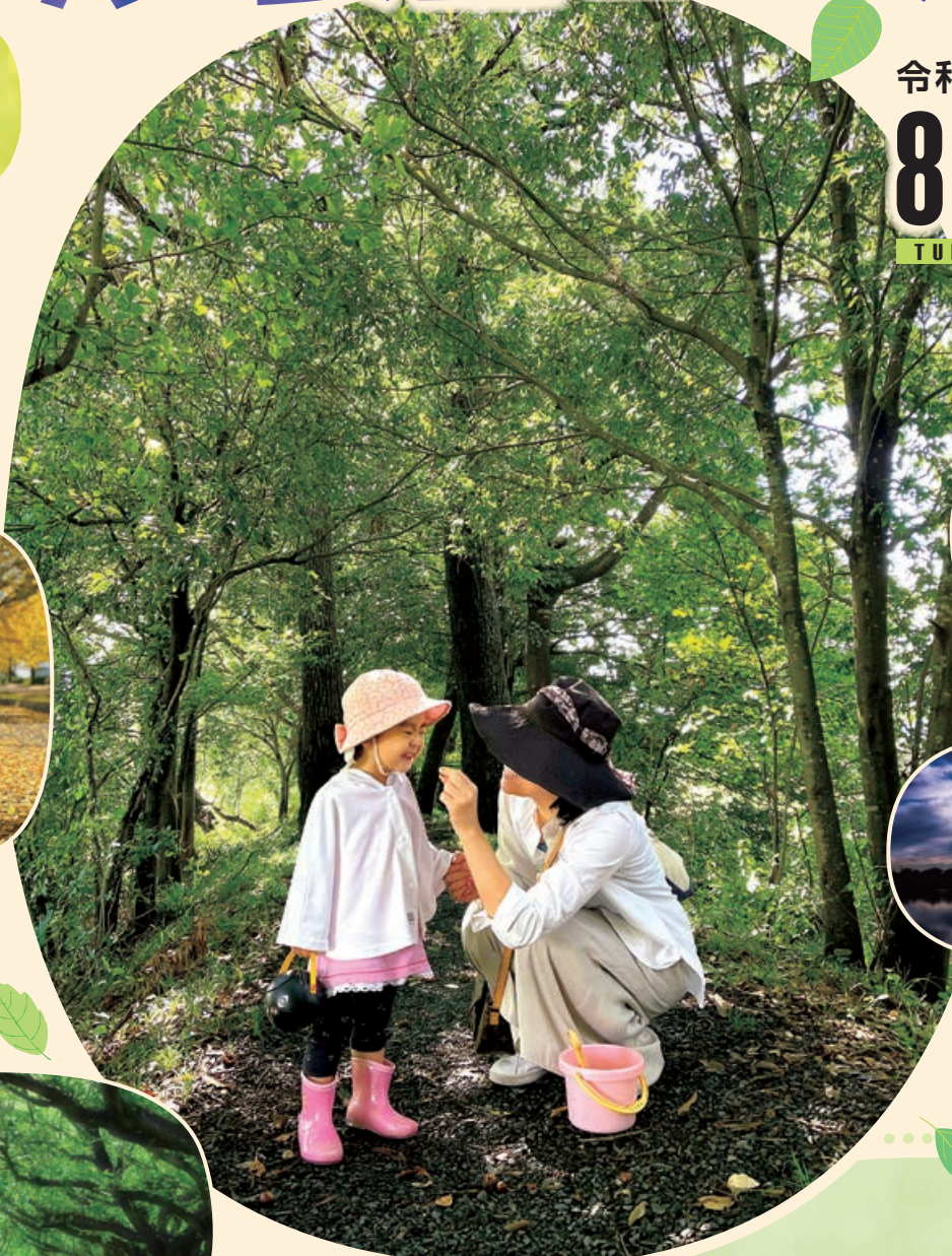
第23回トラスト保全地の部 最優秀賞「ドングリ見〜つけ!!」 (トラスト10号地)