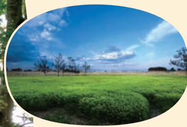
トラスト保全地の部 優良賞「浮野の里」(トラスト10号地)