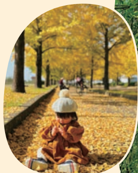
身近な緑の部 最優秀賞「初めての秋」 (加須市)

応募は郵送とInstagram 「#緑のトラストフォト2023」 で応募できます。