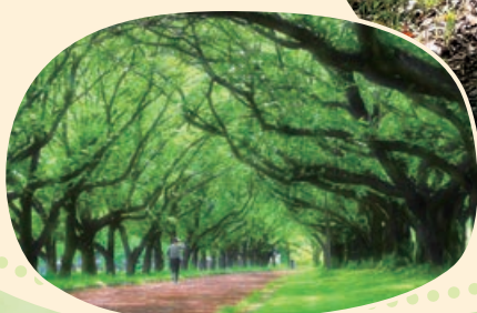
身近な緑の部 最優秀賞「新緑トレーニング」(川越市)