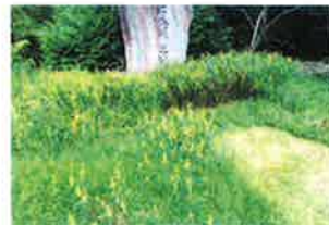
嵐山町名発祥の地石碑前の タヌキマメ群落

このように県内唯一の自生地で細々と生き延びている植物があることを是非知っていただきたく思います。そして温かく見守ってください。