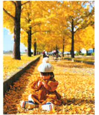
「初めての秋」原 夏実 (加須市)