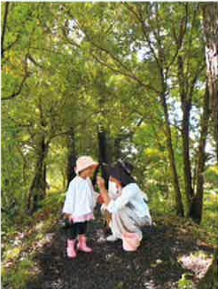
「ドングリ見～っけ!!」柴崎 治 浮野の里 (10号地)