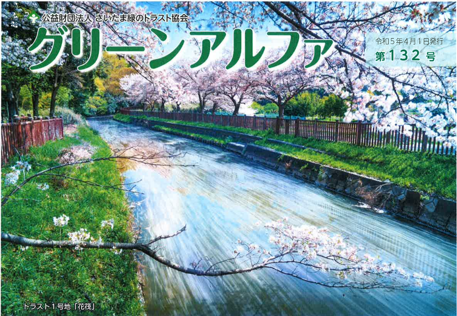
トラスト1号地「花筏」