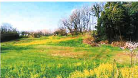
「高尾宮岡の景観地」山中 敏郎 高尾宮岡の景観地 (8号地)