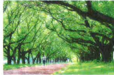
「新緑トレーニング」水上 貴夫 (川越市)